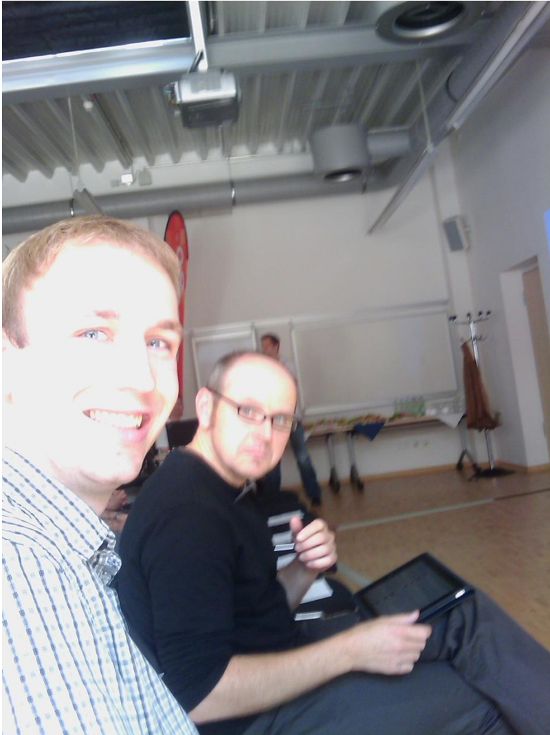
Die Referenten und ITA-Vertreter